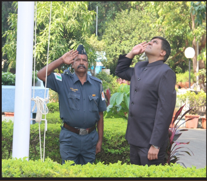
मानवंदना देताना मा. अध्यक्ष व व्यवस्थापकीय संचालक