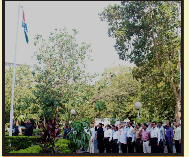
ध्वजारोहण प्रसंगी उपस्थित वरिष्ठ अधिकारी व कर्मचारी