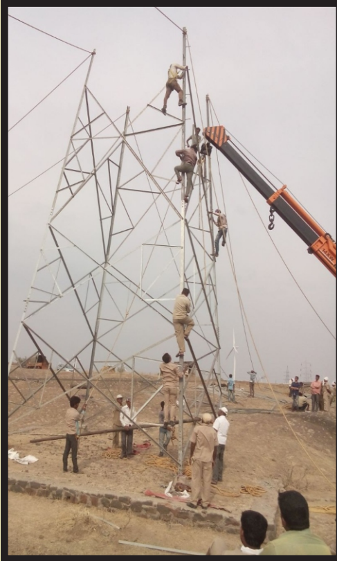
क्षतिग्रस्त मनोऱ्याची पुर्नबांधणी करताना अधिकारी व कर्मचारी

दिनां वन १८.५.२०१६ रोजी जत तालुक्याला बसलेल्या वादळी तडाख्यामुळे ११० के. व्ही. जत-सांखा वाहिनीचा वळसंग येथे असलेल्या विद्युत मनोरा क्र. ४४ जमीनदोस्त झाला होता. सदर मनोऱ्यांचे दुरूस्तीचे काम महापारोषण कंपनीकडून कर्मचारी व अधिकारी यांनी युद्ध पातळीवर पूर्ण करून जत तालुक्याचा विद्युत पुरवठा वेळेपूर्वीच सुरळीत करण्यात आला. महापारोषण कंपनीतील अधिकारी व कर्मचारी वर्गाने सदर